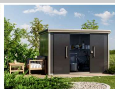
STAURAUIM IM GARTEN