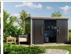
STAUHAUM IM GARTEN