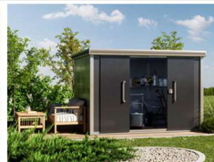
STAUHAUS IM GARTEN